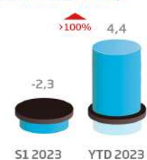
Endettement financier net (consolidé, en MDh)**