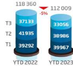
Activité en volume (consolidé, en nbre de dossiers)