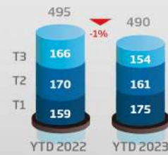
Chiffre d'affaires (consolidé, en MDh)