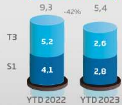
Investissements (consolidé, en MDh)